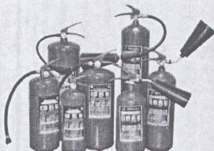
Огнетушители и подставки для них

Ознакомьтесь с другим перечнем нашей продукции