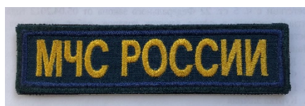
Нагрудный знак «МЧС России»

Нагрудный знак представляет собой щит круглой формы диаметром 80 мм. Поле щита - в цвет основной ткани (19-4324 ТРХ). В центре нагрудного знака в меньшем круге (диаметр 50 мм) расположена малая эмблема МЧС России на преломленном Государственном флаге Российской Федерации. По внешней стороне круга в один ряд буквами желтого цвета нанесена надпись: в верхней части – «МЧС РОССИИ», в нижней части – «EMERCOM». Оба круга имеют окантовку желтого цвета.