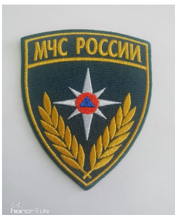
Нарукавный знак МЧС России

Нарукавный знак принадлежности к МЧС России выполнен в виде фигурного щита (высота 110 мм, ширина 85 мм) с окантовкой желтого цвета. Поле щита - в цвет основной ткани (19-4324 ТРХ). В центре щита изображена Малая эмблема МЧС России, обрамленная снизу оливковыми ветвями желтого цвета. В верхней части щита в один ряд буквами желтого цвета нанесена надпись: «МЧС РОССИИ»