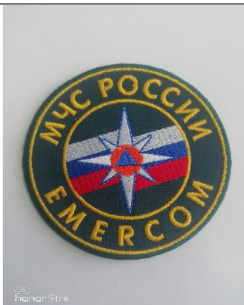
Нагрудный знак круглой формы

Нагрудный знак представляет собой щит круглой формы диаметром 80 мм. Поле щита - в цвет основной ткани (19-4324 ТРХ). В центре нагрудного знака в меньшем круге (диаметр 50 мм) расположена малая эмблема МЧС России на преломленном Государственном флаге Российской Федерации. По внешней стороне круга в один ряд буквами желтого цвета нанесена надпись: в верхней части – «МЧС РОССИИ», в нижней части – «EMERCOM». Оба круга имеют окантовку желтого цвета.