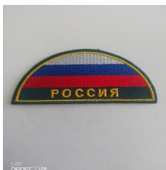
Нарукавный знак в виде полукруга, символизирующего Государственный флаг РФ

Нарукавный знак принадлежности к МЧС России выполнен в виде фигурного щита (высота 110 мм, ширина 85 мм) с окантовкой желтого цвета. Поле щита - в цвет основной ткани (19-4324 ТРХ). В центре щита изображена Малая эмблема МЧС России, обрамленная снизу оливковыми ветвями желтого цвета. В верхней части щита в один ряд буквами желтого цвета нанесена надпись: «МЧС РОССИИ»