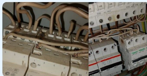
1. Контакты (автоматы) со следами нагрева, плавления