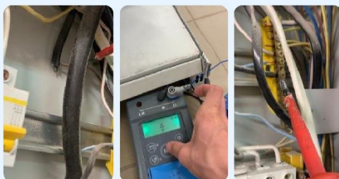
1. Наличие незаизолированных жил кабеля 2. Не заземлены стеллажи торгового зала 3. Многопроволочные проводники без наконечников