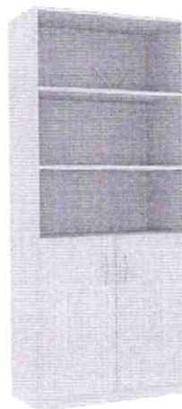
Образец внешнего вида шкафа для документов